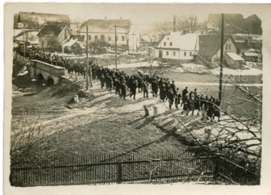
Autor: JUDr. PhDr. Petr Hůlka